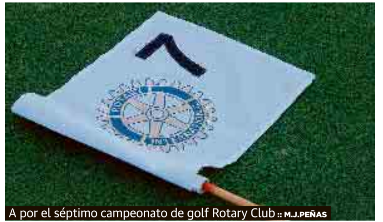
A por el séptimo campeonato de golf Rotary Club :: M.J. PEÑAS