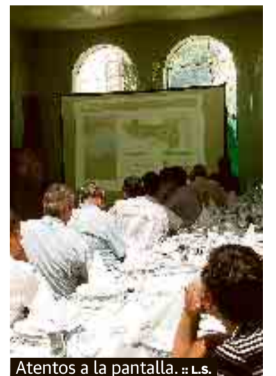
Atentos a la pantalla.