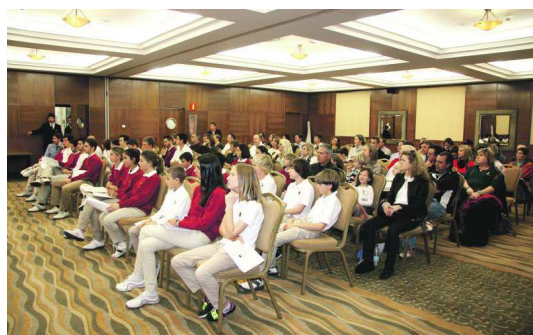
En uno de los salones del Hotel Intercontinental Mar Menor se reunieron alumnos y padres para escuchar las explicaciones de los responsables de la federación.