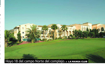
Hoyo 18 del campo Norte del complejo. LA MANGA CLUB

los votos -32% más que el segundo clasificado-. Convertidos en el equivalente de los 'Oscar' en el sector de golf, estos galardones son elegidos por los lectores de la publicación inglesa, en colaboración con la operadora de viajes de golf 'Your Golf Travel', premiando a los mejores campos y destinos de golf del mundo. Los ganadores serán publicados en el número de febrero de la revista Today's Golfer (versión impresa).