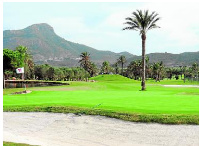
El nuevo 'green' del 17 visto desde su parte posterior. Al fondo el 'tee' de salida del hoyo.