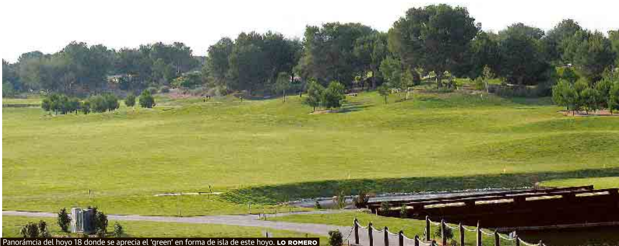
Panorámica del hoyo 18 donde se aprecia el 'green' en forma de isla de este hoyo. LO ROMERO